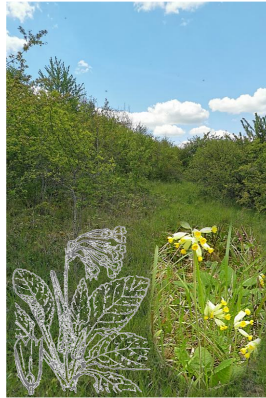
Photo paysage R. Vandeweghe ; photo Primula veris : X. Houard et illustration flore de l'abbé Coste

La femelle pond sur le revers des feuilles de diverses espèces de primevères . Dans notre région, sa plante-hôte principale est la Primevère officinale ( Primula veris ) également appelée « Coucou », mais les femelles peuvent parfois utiliser la Primevère élevée ( Primula elatior ) ou la Primevère acaule ( Primula vulgaris ).