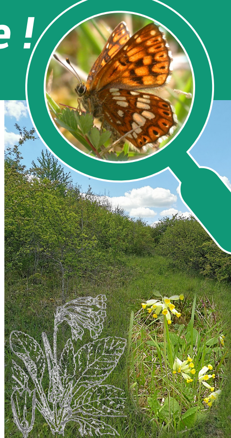
Photo paysage R. Vandeweghe ; photo Primula veris : X. Houard et illustration flore de Abbé Coste

La femelle pond sur le revers des feuilles de diverses espèces de primevères . Dans notre région, sa plante-hôte principale est la Primevère officinale ( Primula veris ) également appelée « Coucou », mais les femelles peuvent parfois utiliser la Primevère élevée ( Primula elatior ) ou la Primevère acaule ( Primula vulgaris ).